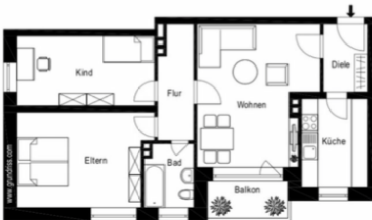
Grundriss 3 Zimmer ETW