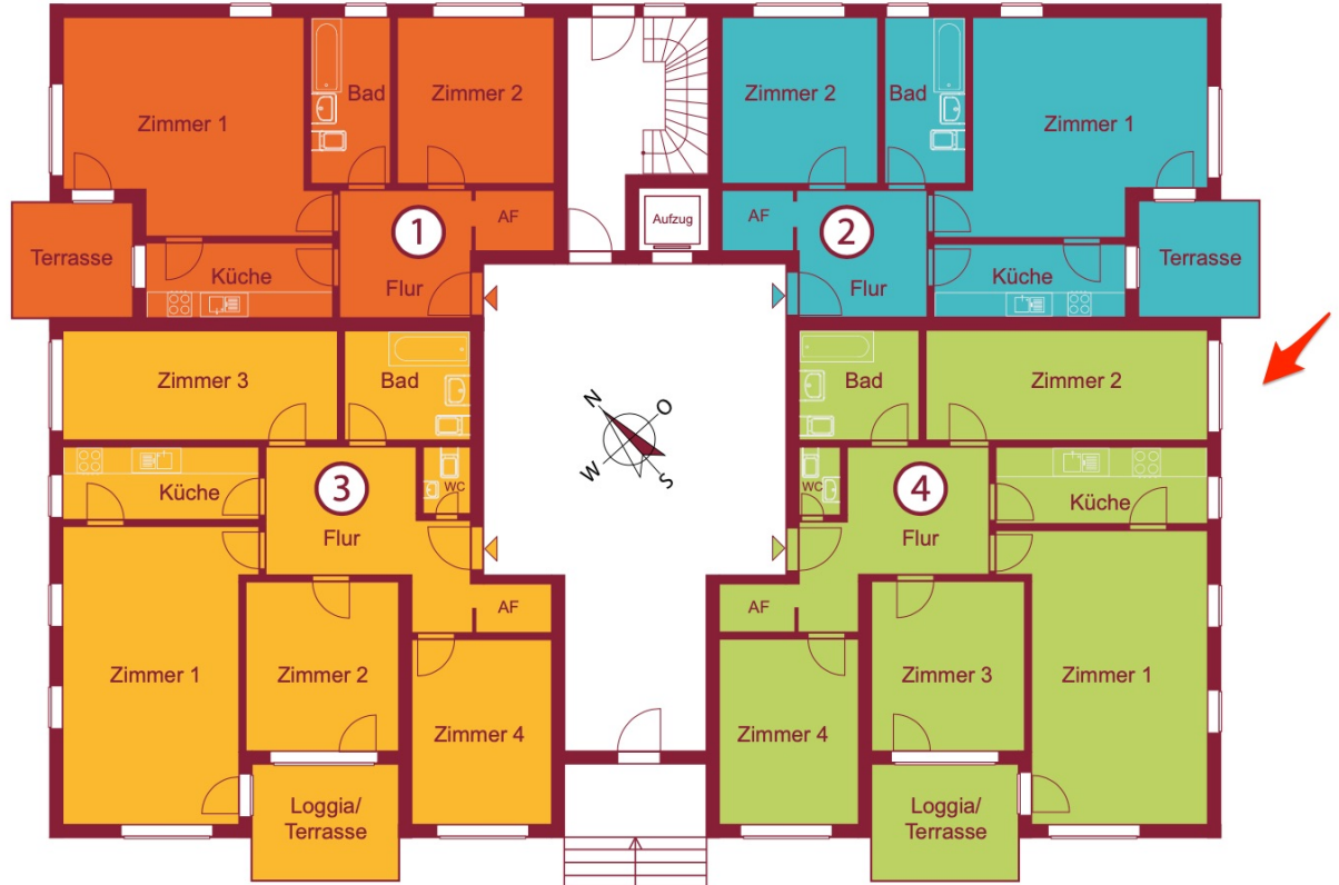
Straßenseite Vienweg 100