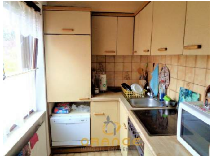
Küchenbereich mit Fenster